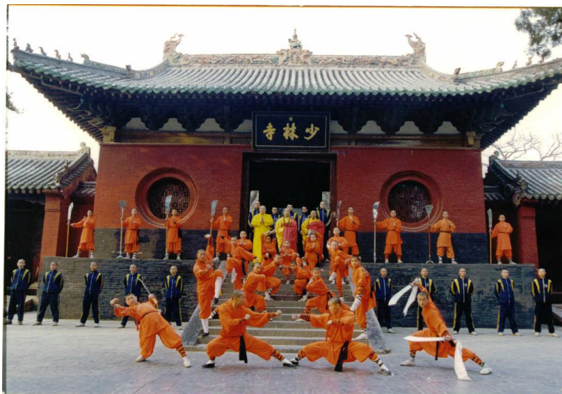
Le Temple de Shaolin

Renseignements : KUNG FU DEVELOPPEMENT – BP 122 – 38551 St Maurice Cedex ☎ : 04 74 29 54 72 / 04 67 07 57 97 / 06 14 36 27 22 / 06 08 32 93 43 E-mail : infos.kungfushaolin@wanadoo.fr Sites Internet : www.kungfuasso.com http://kungfushaolin.free.fr